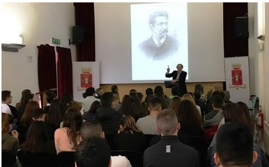
Un'immagine dalle proiezioni

Il progetto scolastico "Il mondo in guerra visto dal cinema e dai media. 1914-1945" , elaborato dall' Istituto superiore Bacaredda-Atzeni di Cagliari e Capoterra e patrocinato dal Comando Militare Esercito Sardegna, ha anche partecipato al bando sulla didattica del cinema 2017 pubblicato dalla Regione Sardegna e dedicato al 100esimo anniversario della fine della prima Guerra mondiale, risultando primo tra tutti progetti presentati.