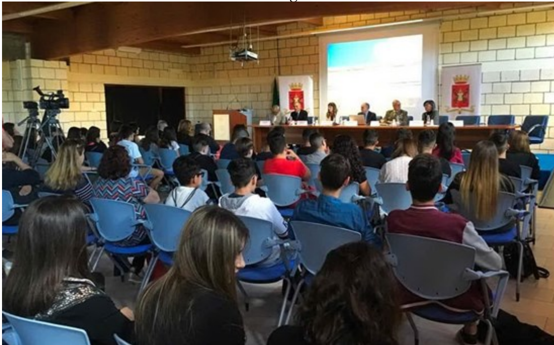
Un'immagine dalla conferenza

Con la conferenza storica del professor Emilio Gentile dal titolo " Pro patria mori. Il culto dei caduti dalla Grande Guerra alla guerra del Vietnam ", si è conclusa sabato 9 giugno a Barumini la rassegna cinematografica "Il mondo in guerra visto dal cinema e dai media".