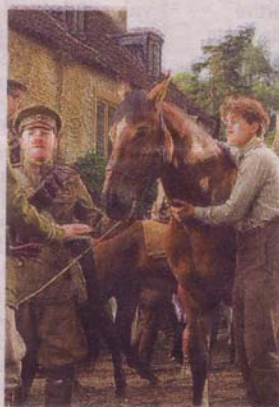
Una scena del film War horse