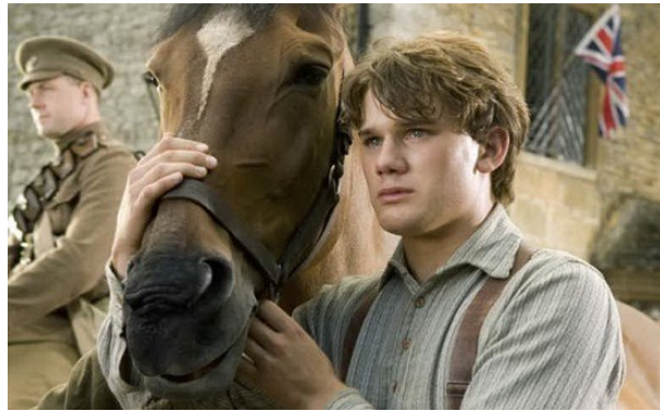
Un'immagine dal film "War Horse"

Prosegue, con la proiezione del film "War Horse" nella sala consiliare del Comune di Capoterra (mercoledì 21 febbraio, alle 9.30), la rassegna cinematografica "Il mondo in guerra visto dal cinema e dai media 1914-1918/1939-1945", progetto scolastico promosso dall'I.I.S. Bacaredda-Atzeni di Cagliari in collaborazione con il Comando Militare Esercito Sardegna.